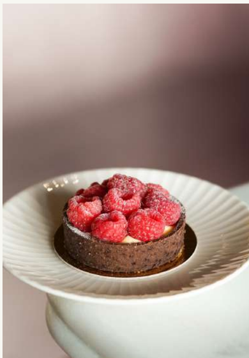
mini tarta owocowa

Krucze maślane ciasto, dostępne również w wersji czekoladowej, delikatny krem budyniowy, do wyboru owoce sezonowe.