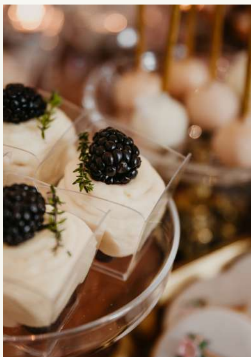
deser w kubeczku

Musy w różnych smakach z dodatkiem owoców lub pralinek z dekoracją dopasowaną do stylu uroczystości.