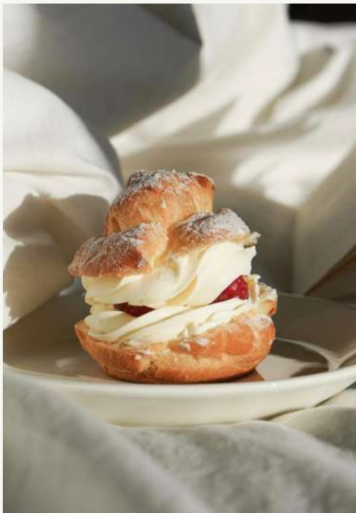
ptyś z malinami

Ciasto parzone, krem mascarpone, domowa konfitura malinowa i świeże maliny.