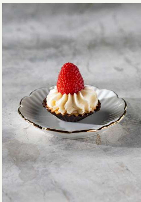
babeczka z maliną

Krucha maślana babeczka z konfiturą malinową i kremem budyniowym.