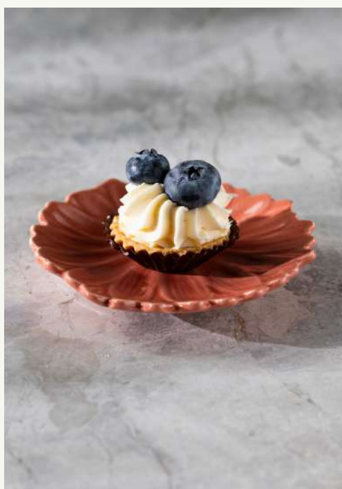
babeczka z borówką

Krucha maślana babeczka z konfiturą borówkową i kremem budyniowym.