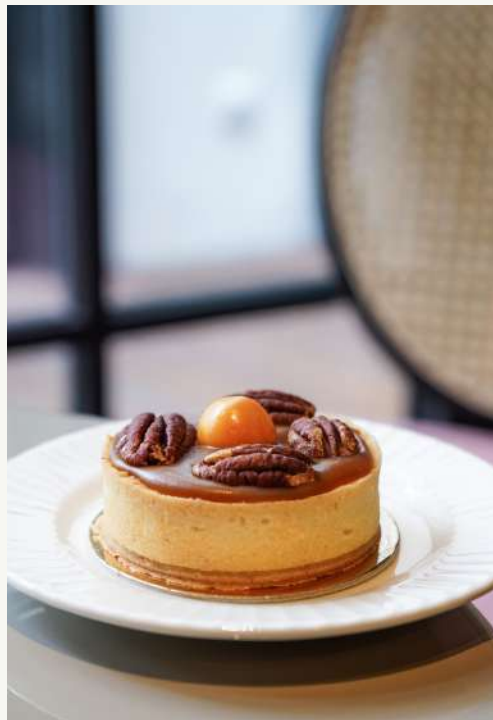
mini tarta słony karmel

Krucze maślane ciasto, słony karmel z orzechami pekan.