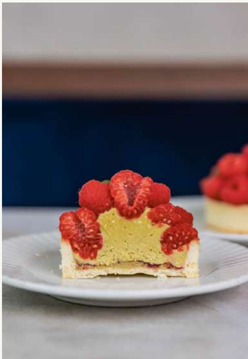
mini tarta pistacja

Krucze maślane ciasto, cienka warstwa konfitury malinowej, intensywnie pistacjowy krem z kawałkami pistacji i świeże maliny.