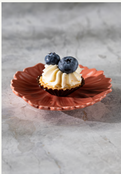
babeczka z borówką

krucha maślana babeczka z konfiturą borówkową i kremem budyniowym