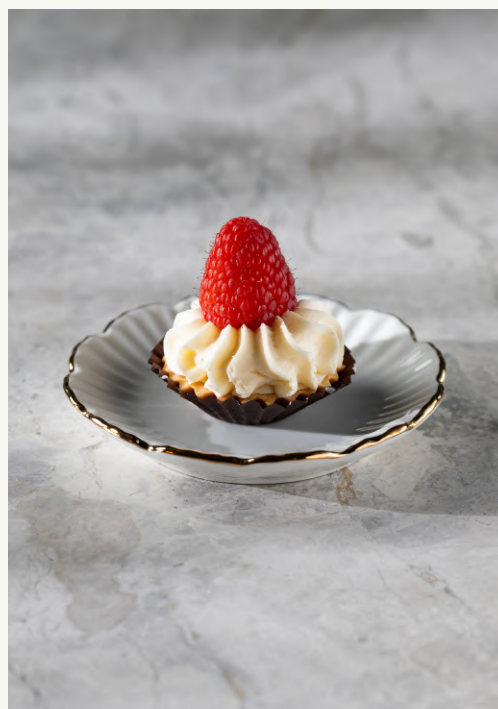
babeczka z maliną

krucha maślana babeczka z konfiturą malinową i kremem budyniowym