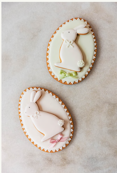
jajo z królikiem